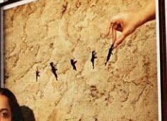
تصويراً لشوك فيرما