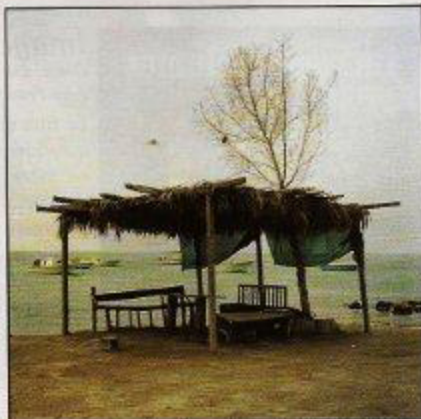
Camille Zakharia, Courtesy of Art Sawa Gallery

PO Box 212592, Dubai, UAE Tél: +971 4 3408660 www.artsawa.com